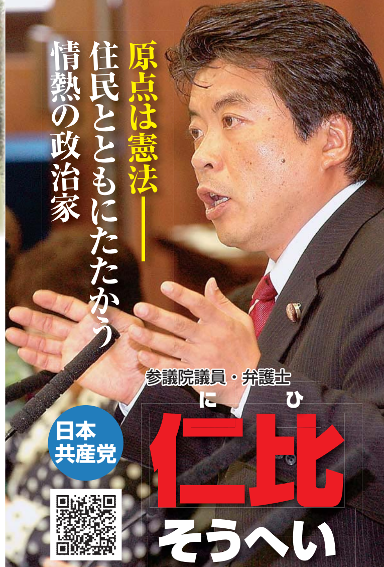
参議院議員・弁護士 にひ